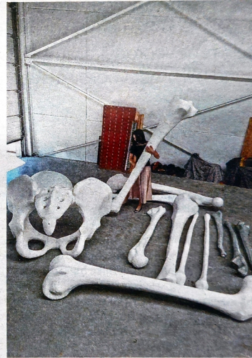
De verschillende delen van het reusachtige skelet. De schedel van de reus is gebaseerd op een scan van het hoofd van de Truiense kunstenaar.

schedel van de reus is gebaseerd op mijn hoofd. Ik heb een scan laten nemen. Die zie je ook terug in werken die ik verkoop. Toen ik dat gedaan had, belde de dokter me op: bleek dat ik een cyste in mijn hoofd had zitten van 2 centimeter groot. Niet kwaadaardig, gelukkig, maar dan sta je toch ook even stil bij je eigen vergankelijkheid." Geen ondernemer van nature dus. En wat Herck ook niet is: een architect of ingenieur. "Bij een werk van die grootte - en dan nog eens op een openbare plek - komen tal van restricties en regels kijken. Het moet bijvoorbeeld tegen windvlagen kunnen. Het moet op een stevige fundering staan. Ingenieurs en architecten zien me niet graag komen, want ik zie een werk in mijn hoofd, maar van praktische shit ken ik niks. Dat moeten zij allemaal berekenen. Met volledig in België uitgetekende plannen ben ik naar Venetië getrokken, maar ook daar moet dan alles nog door commissies en deskundigen goedgekeurd worden. Dat kost dan ook weer geld."